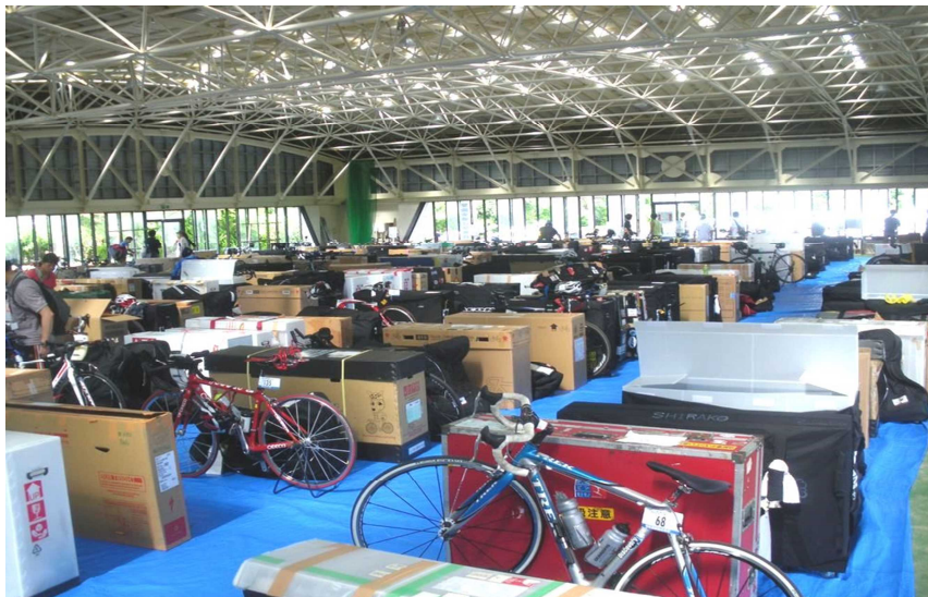
■バイク保管場所&宅配受付場所（B&G海洋センターすぱーく天城）

バイクのパンク修理用エアポンベ（エアカートリッジ等）とスペアタイヤは、機内持込み禁止になっていますので、バイクの託送（宅配便）と同時にお送り下さい。 ※空港預かり禁止